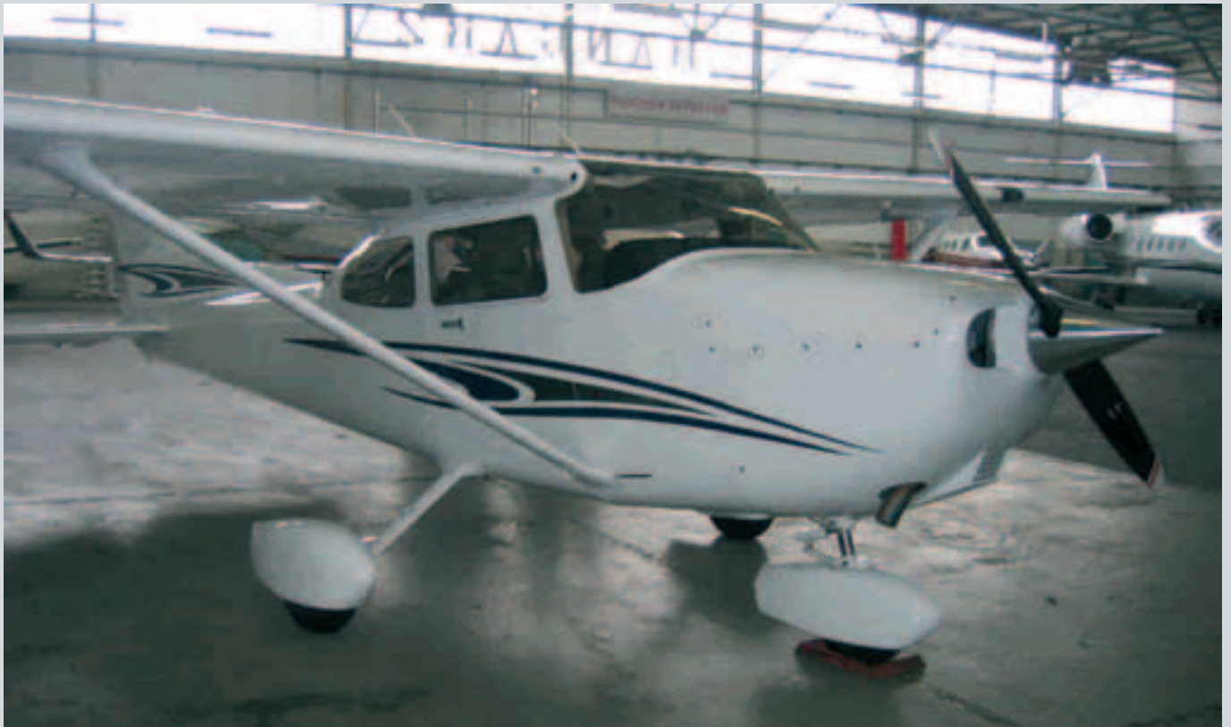
C172 mit dem Kennzeichen OE-DBA