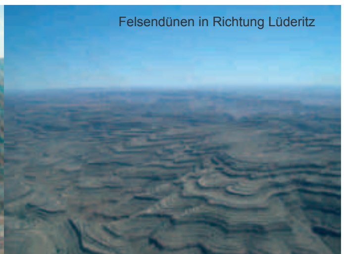
Felsendünen in Richtung Lüderitz