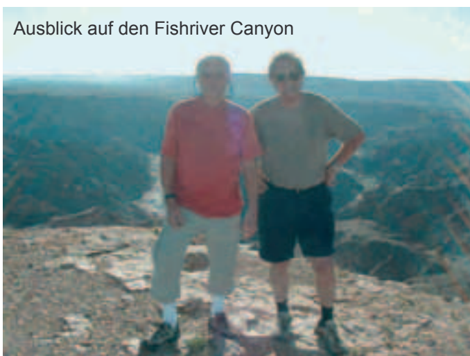
Ausblick auf den Fishriver Canyon

Nachdem wir gemäß der Tower-Anweisung gelandet waren, musste Siegi zum Controller Rapport, es war uns vorgeworfen worden wir hätten die Controllzone von Walfishbay ohne Freigabe durchflogen, „Für ihn war es allerdings nicht schwer, mit der GPS