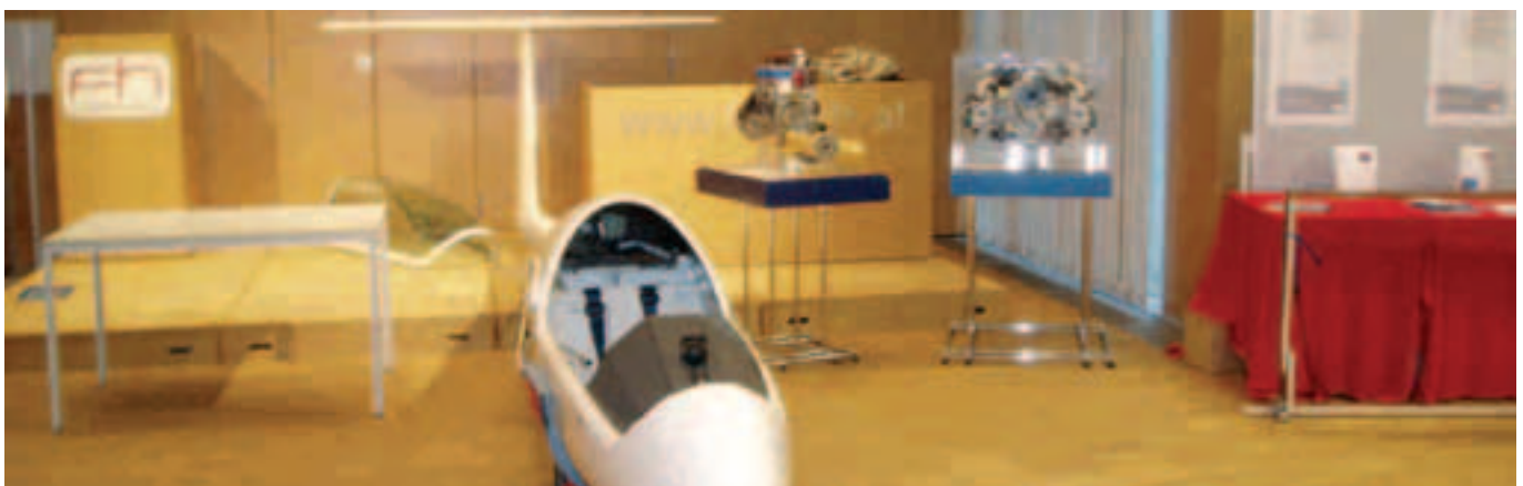
Stand der Weissen Möwe Wels