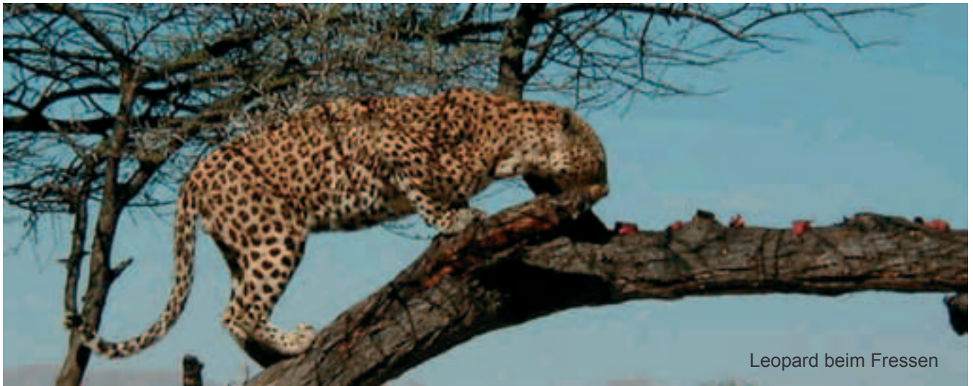
Leopard beim Fressen

dem Krüger Nationalpark entgegen. Während wir auf unserem gesamten Namibia-Trip bestes Flugwetter hatten, mussten wir jetzt mit den Ausläufern eines Tiefs kämpfen, was vor allem beim Überqueren der Draakens-Berge zu problematischen Ausweichmanövern führte, nachdem die Wolken teilweise auflagen. Der Täler Slalom führte uns dann schließlich am Blyde-River Canyon vorbei, übrigens der drittgrößte Canyon der Welt, in die dahinterliegende Ebene, dem eigentlichen Busch.