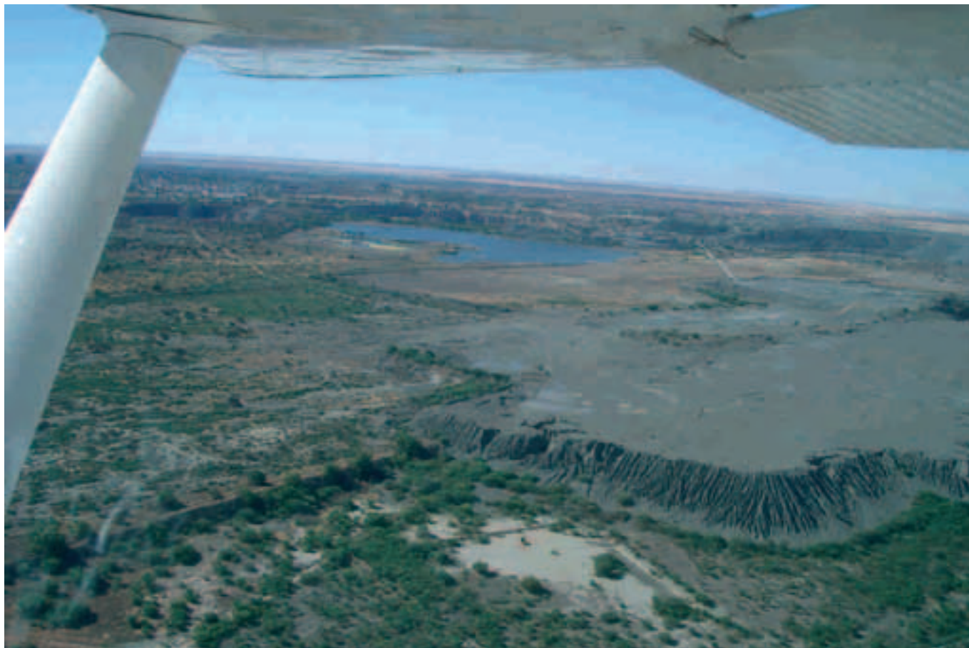
Diamantenabbau in Kimberley

zu sehen und so steuerten wir wegen dem nahenden Einbruch der Dunkelheit wieder Kittmannshoop an. Unseren ersten Abend im Busch hatten wir uns etwas romantischer vorgestellt.