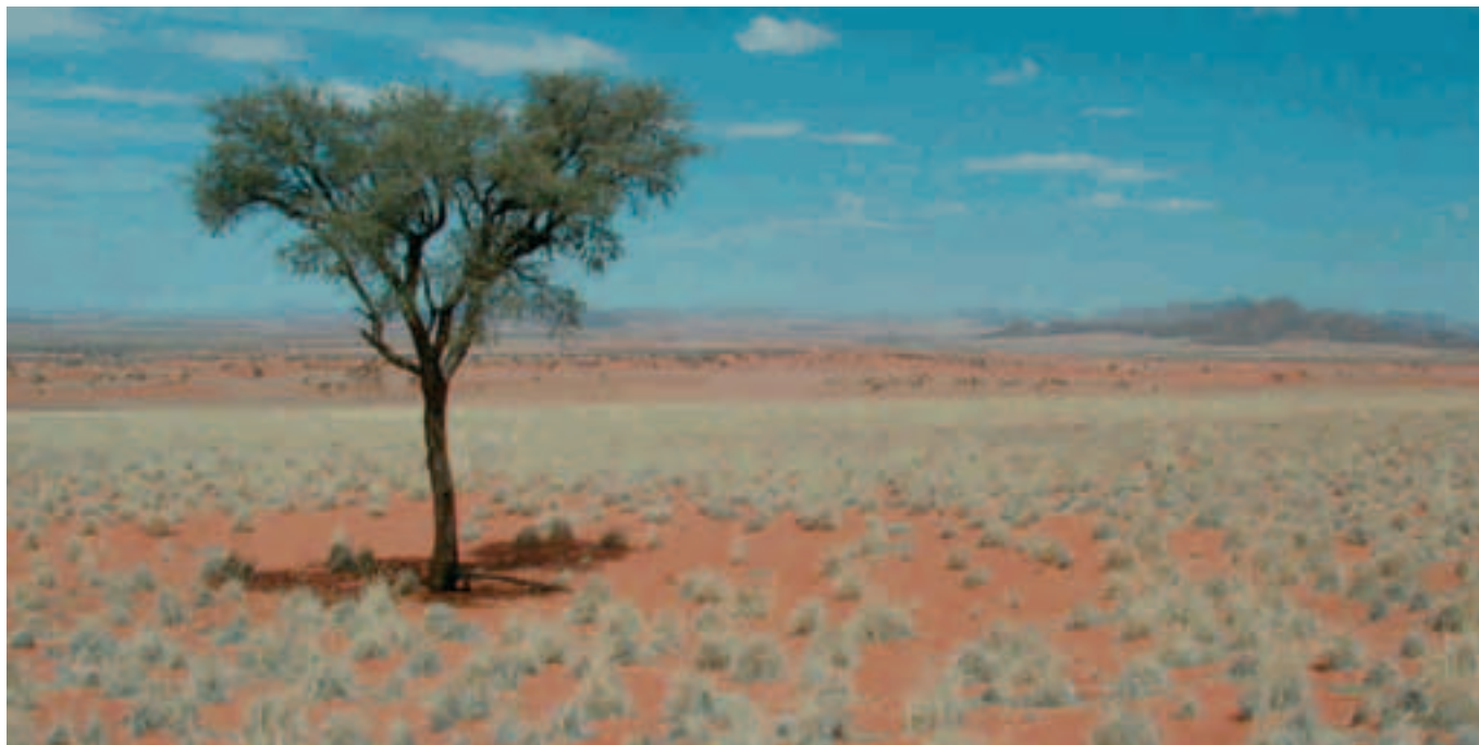
Steppenlandschaft im Herzen Namibias

wunderschönen Hochleistungssegler wie Nimbus und ähnliche Geräte. Letztlich kamen wir doch noch zu einem wohlschmeckenden Lunch und einem wohlverdienten Bier, das uns freundliche Herero- und Namamädchen in einem professionellen Gästeservice servierten. Diese Mädchen sprechen in der Regel zwei Bandtuschsprachen, in jedem Fall Englisch und meistens auch Deutsch. Das Menü wird zunächst Englisch angekündigt und dann in der äußerst lustigen „Klick-Sprache“ wiederholt. Schmunzeln und Beifall sind bei diesen Vorstellungen immer gewiss. Diese Klick-Sprachen sind ja wirklich zungenbrecherische Akrobatik.