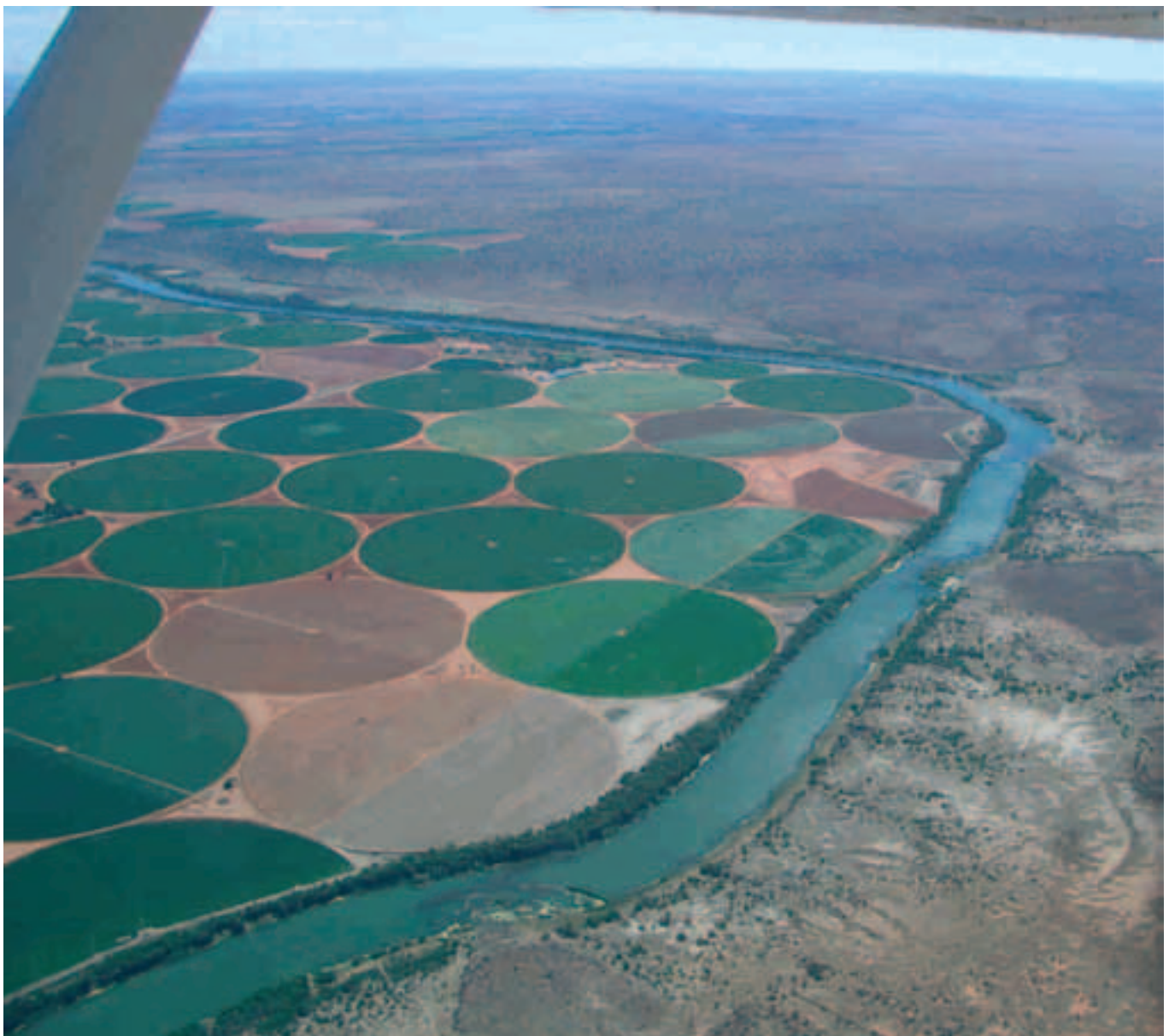
Bewässerungsanlagen am Vaalriver

Der Flug über den Canyon gestaltete sich sowohl landschaftlich als auch fliegerisch zu einem einmaligen Erlebnis, nur von der Lodge und vom Landstrip war weit und breit nichts