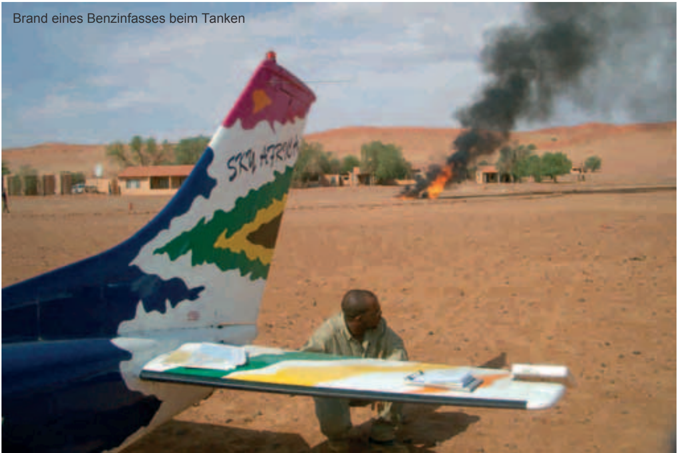
Brand eines Benzinfaßes beim Tanken

schnell gefunden, nicht aber unser schlecht markierter Landstrip. Unser Aufsetzen verursachte eine riesige Staubwolke die den stark auftretenden Windhosen zeitweilig Konkurrenz machte.