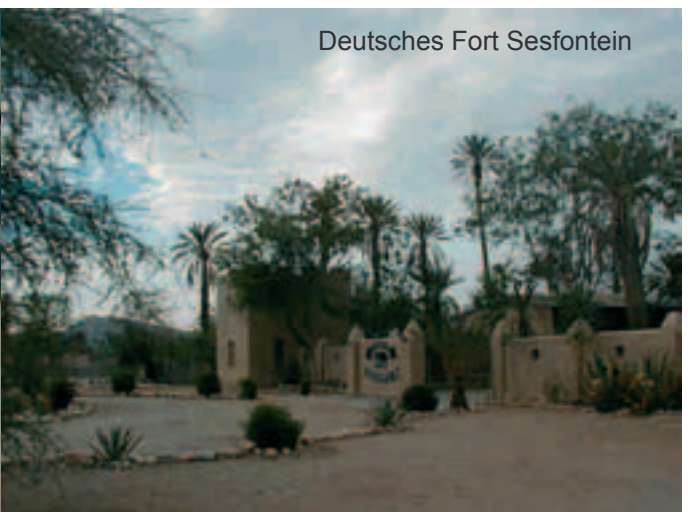
Deutsches Fort Sesfontein