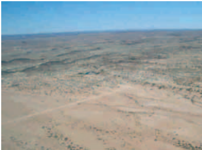
Erste Aussenlandung am Canyonriver