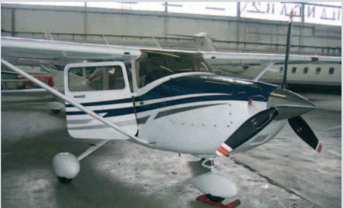
C182 mit dem Kennzeichen OE-DBS