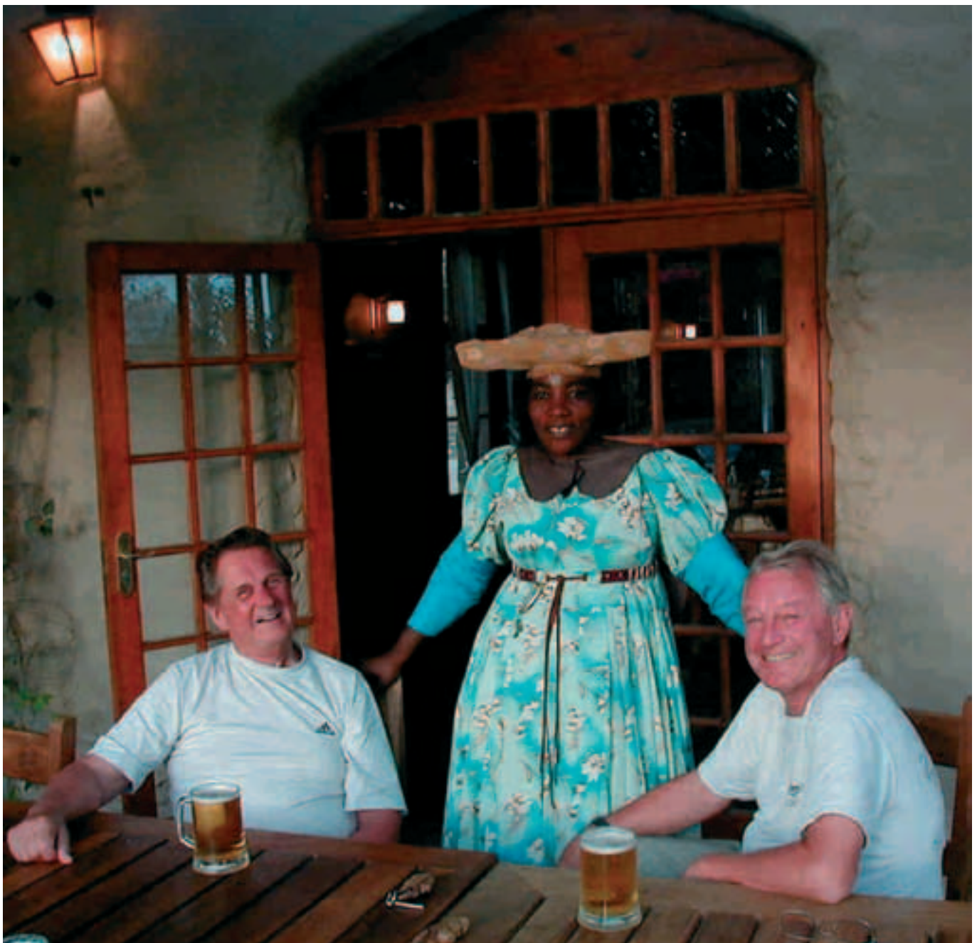
Typische "Kellnerin" in der Landestracht

Großer Irrtum! Zunächst warteten wir über 1 ½ Stunden wegen eines telefonischen Missverständnisses auf die Abholung. Nachdem der Landrover zur Abholung vorfuhr, sagte die uns etwas trocken wirkende Dame am Steuer, dass wir erst am nächsten Tage eingebucht hätten und die Lodge bis auf den letzten Platz ausgebucht