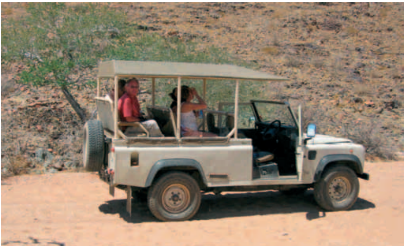
Safari im Jeep

Eine dazwischen liegende Bergkette machte es notwendig auf 6.500 ft zu steigen. Das Tal der Windhosen war