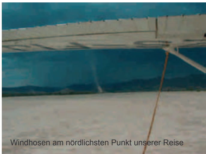
Windhosen am nördlichsten Punkt unserer Reise