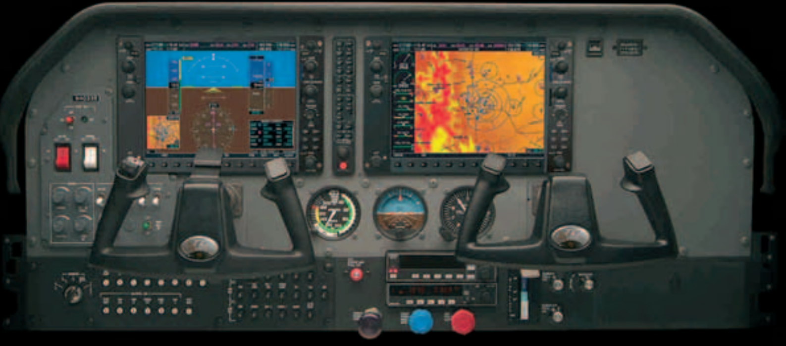
Ansicht des Garmin G1000 Glascockpit unserer beiden neuen Flugzeuge