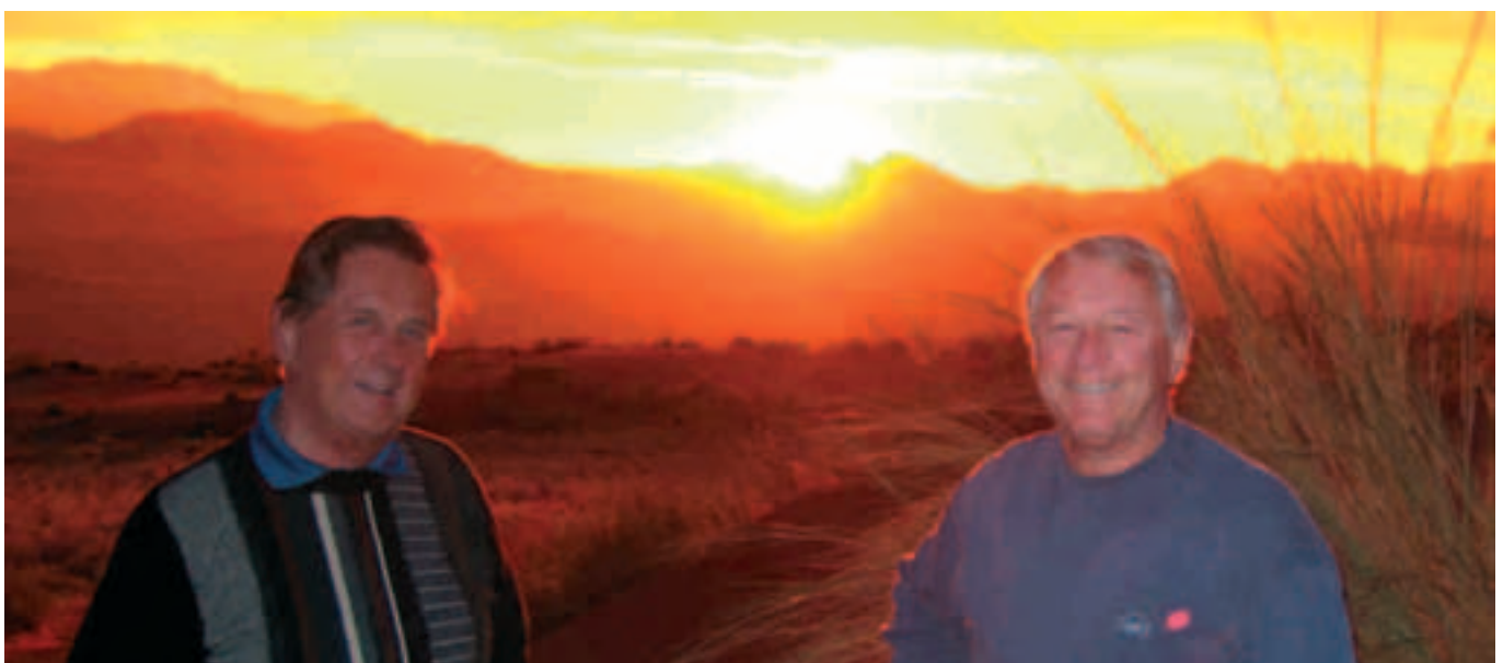
Gigantischer Sonnenuntergang in der Namib Wüste

Ein Highlight war eine Elefantenherde die eine „Fressschneise“ durch den